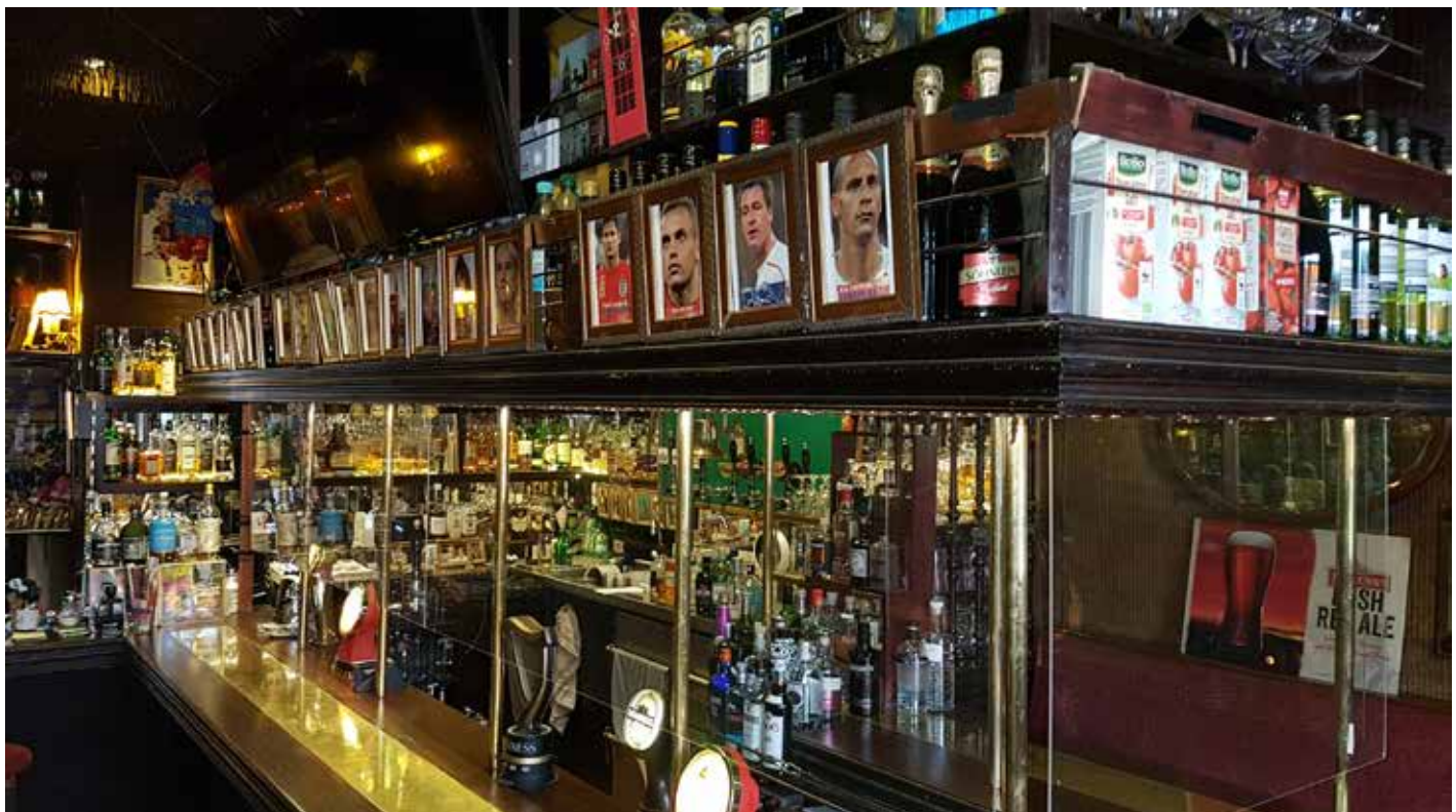
Umsetzung: Alte Liebe, Hannover Shakespear English Pub, Hannover